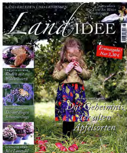
Ein Mädchen vom Lande ziert das Cover

Dass eingefleischte Landlust-Liebhaber jetzt umschwenken, ist nicht zu erwarten. Schon durch Liebes Land verlor Landlust nicht, sondern gewann an verkaufter Auflage: Von rund 317.000 verkauften Ex-