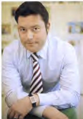
Christian Hellmann ist redaktionell verantwortlich

Das redaktionelle Konzept sieht "populäre Wissensthemen in opulenter Optik" vor. Im Heft wird es die Rubriken 'Natur und Umwelt', 'Wissenschaft', 'Gesundheit', 'Report', 'Geschichte', 'Biographie', 'Geistesblitze' sowie 'Meisterwerke' geben. Hinzu kommen Rätsel.